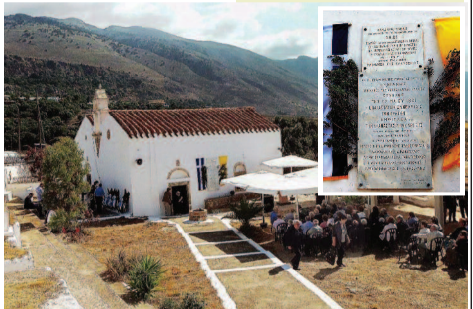
Παρουσία πλήθους κόσμου τιμήθηκε και φέτος στα Σφακιά, η επέτειος από την κήρυξη της επανάστασης του 1821 στην Κρήτη. Η εκδήλωση πραγματοποιήθηκε στην Θυμιανή Παναγία στις Κομητάδες

Η Επανάσταση του 1821 εξαπλώνεται αμέσως και στην Κρήτη, παρά τη στρατιωτική υπεροχή του τουρκικού στοιχείου, την παντελή έλλειψη όπλων και εφοδίων και την άγρυπνη επιτήρηση των τουρκικών αρχών. Οι αγώνες της Κρήτης, που κινούνται στο ίδιο ιστορικό πλαίσιο με τον ξεσηκωμό της υπόλοιπης Ελλάδας, διαρκούν 10 χρόνια και περνούν από φάσεις επιτυχίας, αλλά και οδυνηρών συνεπειών, μέσα από συνεχείς αναζωπυρώσεις και σκληρές απόπειρες καταστολής και με ποταμούς αιμάτων ηρώων αγωνιστών.