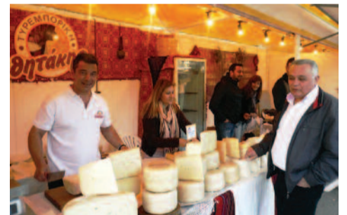
Σφακιανά προϊόντα στην έκθεση του Ζαππείου.

Αξιοσημείωτη υπήρξε η φιλοξενία του Δήμου Θεσσαλονίκης και ιδιαίτερα του Δημάρχου Γιάννη Μπουτάρη , αλλά και η προ-