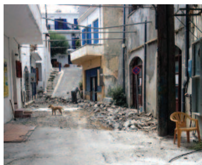
Πάνω: Η Ήμπρος μετά τα έργα ανάπλασης. Κάτω (αριστ.) Ο Πατσιανός μετά τα έργα και (δεξιά) Αρχισαν τα έργα και στη Χ. Σφακίων.