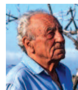
Νικηφόρος Βρεττάκος (1912 - 1991) Κορυφαίος Έλληνας ποιητής και πεζογράφος.

Είναι μια βαριά κληρονομιά, την οποία μας κληροδότησαν οι παππούδες και οι πατεράδες μας. Και μας βαραίνει το χρέος μας να διαφυλάξουμε το πολυτίμητο αυτό αγαθό και να το παραδώσουμε στα παιδιά μας με την εντολή να το μεταλαμπαδεύσουν στις επερχόμενες γενιές των Κρητικών.