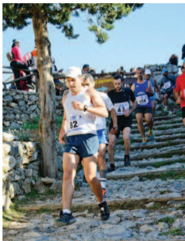
Στο Ξυλόσκαλο Ομαλού

νίων του Ε.Ε.Σ. βοήθησαν πολύ με την εμπειρία τους σε τέτοιες διοργανώσεις. Η Κλινική ΓΑΒΡΙΑΚΗ Α.Ε.-Θεραπευτήριο ΙΑΣIS διέθεσε ένα από τα ασθενοφόρα της, το οποίο στάθμευσε στο Ξυλόσκαλο Ομαλού, καθ'