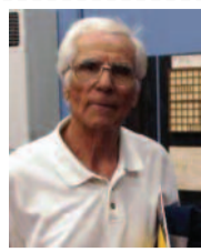
Ο Καθηγητής και Συγγραφέας Αντώνης Β. Ξανθινόκης