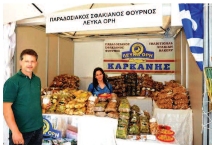
Περίπτερο Σφακιανών προϊόντων στην έκθεση της Θεσσαλονίκης.

Η Ένωση μας, στηρίζει αυτή την προσπάθεια, με όλες της τις δυνάμεις.