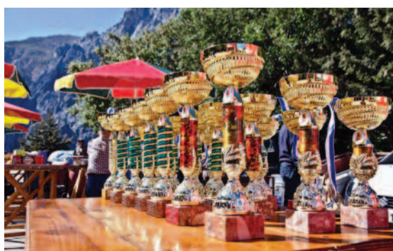
Κύπελα και μετάλλια για τους νικητές...