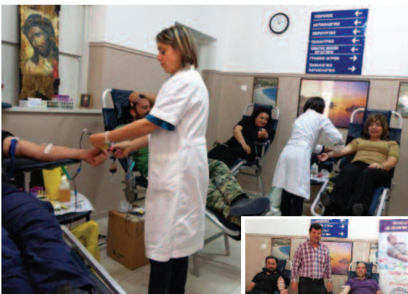
Για τρίτη φορά οι Σφακιανοί ανταποκρίθηκαν μαζικά στο κάλεσμα ανθρωπιάς και αλληλεγγύης. Η συμμετοχή τους στην Εθελοντική Αιμοδοσία, ήταν εντυπωσιακή.

Υπάρχουν άνθρωποι που κινδυνεύουν και το έχουν άμεση ανάγκη! Ας δείχνουμε την Ανθρωπιά και το Φιλότιμό μας σε κάθε τέτοια Δράση!