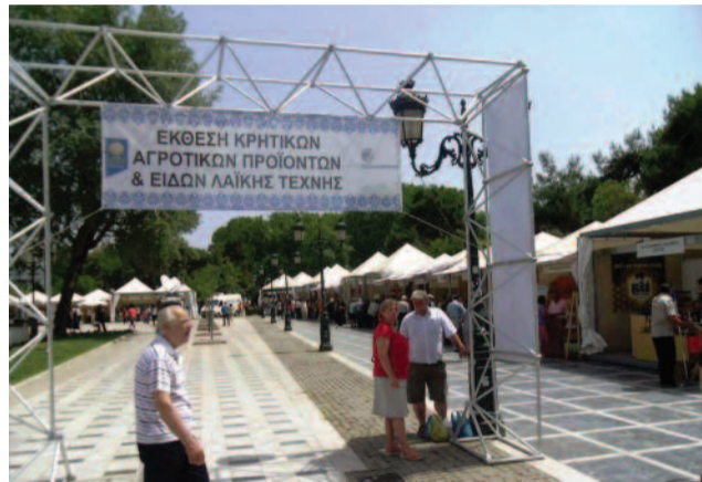
Η είσοδος της έκθεσης «ΑΓΡΟΤΙΚΟΣ ΑΥΓΟΥΣΤΟΣ 2013» στη Θεσσαλονίκη

Εκτός από το εμπορικό μέρος, έγιναν και καθημερινές επιστημονικές ημερίδες ενημέρωσης πάνω στην παραγωγή, την μεταποί-