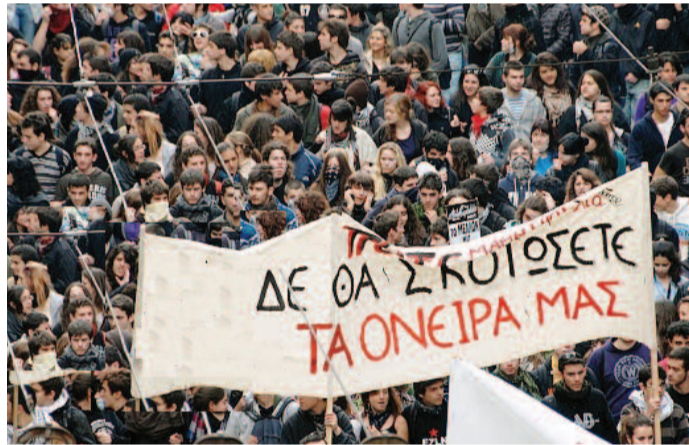
Σκοτώνουν τα όνειρα μας, ας μην τους αφήσουμε να σκοτώσουν τα όνειρα των παιδιών μας...

Η κοινωνία, πρέπει να εξασφαλίζει ισότιμα για όλους, την πρόσβαση στη γνώση και στον πλούτο της ανθρωπίνης σκέψης και του πολιτισμού. Ο μεγαλύτερος πλούτος σε κάθε κοινωνία, είναι η