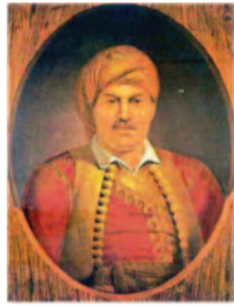
Ο Ηπειρώτης ήρωας Χατζημιχάλης Νταλιάνης

Εκδήλωση - Ομιλία με θέμα: " Ο Ηπειρώτης Ήρωας Χατζημιχάλης Νταλιάνης και οι Δροσουλίτες - Η Μάχη του Φραγκοκάστελλου"