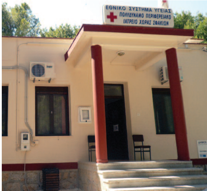
Το Πολυδύναμο Περιφερειακό Ιατρείο Χ. Σφακίων.