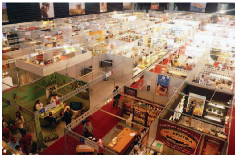
Η καρδιά της Κρήτης χτύπησε στο στάδιο Tae kwon do στο Φάληρο, στην έκθεση: "Κρήτη η μεγάλη συνάντηση" .

Συνδιοργανωτής στο μεγάλο αυτό γεγονός, ήταν η Περιφέρεια Κρήτης, με αρκετούς δήμους από