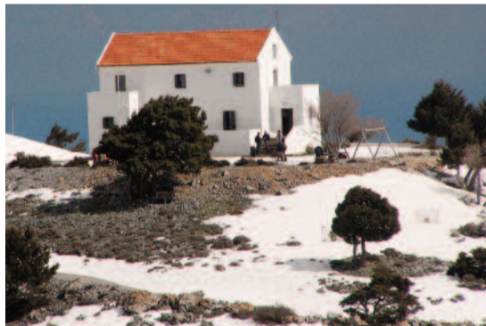
Το καταφύγιο της Ταύρης στ' Ασκύφου

Ο Ορειβατικός Σύλλογος Χανίων στην προσπάθειά του να ανεβάσει όλο και περισσότερα παιδιά στο βουνό, διοργανώνει δύο υπαίθρια Παιδικά Ορειβατικά Κέντρα , για παιδιά (αγόρια και κορίτσια) ηλικίας 10 μέχρι 15 χρονών, το πρώτο από 29 Ιουνίου έως και 7 Ιουλίου 2013 και το δεύτερο από 7 Ιουλίου έως και 11 Ιουλίου 2013.