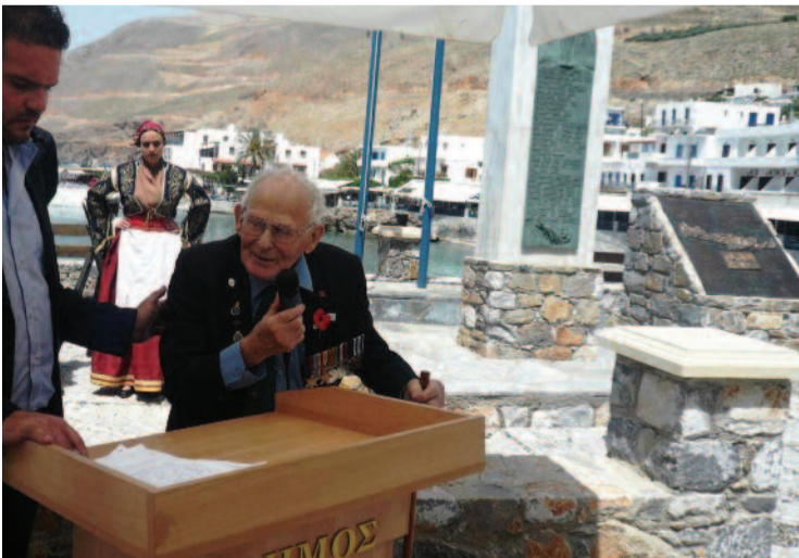
Ο Νέοζηλανδός Ροϊ Χάμοντ - 95 ετών, αγωνιστής στη Μάχη της Κρήτης, εξιστόρησε το πως βρέθηκε στα Σφακιά και εξέφρασε την ευγνωμοσύνη του για τους Σφακιανούς που τον βοήθησαν για δύο χρόνια στα βουνά.

«ΠΡΟΣ ΤΙΜΗ ΤΩΝ ΚΑΤΟΙΚΩΝ ΤΗΣ ΔΥΤΙΚΗΣ ΚΡΗΤΗΣ ΓΙΑ ΤΙΣ ΘΥΣΙΕΣ ΠΟΥ ΕΚΑΝΑΝ, ΠΑΡΑΧΩΡΩΝΤΑΣ ΑΣΦΑΛΕΣ ΚΑΤΑΦΥΓΙΟ ΣΕ ΠΟΛΛΟΥΣ ΑΥΣΤΡΑΛΟΥΣ, ΝΕΟ ΖΗΛΑΝΔΟΥΣ, ΒΡΕΤΑΝΟΥΣ ΚΑΙ ΚΥΠΡΙΟΥΣ ΣΤΡΑΤΙΩΤΕΣ ΚΑΤΑ ΤΗΝ ΠΕΡΙΟΔΟ 1941-1945. Η ΤΕΛΕΥΤΑΙΑ ΟΜΑΔΑ ΣΤΡΑΤΙΩΤΩΝ ΕΚΚΕΝΩΣΕ ΤΗΝ ΤΡΥΠΗΤΗ, ΜΕ ΤΗ ΒΟΗΘΕΙΑ ΤΟΥ ΒΑΣΙΛΙΚΟΥ ΝΑΥΤΙΚΟΥ, ΣΤΙΣ 7-8 ΜΑΪΟΥ 1943. ΕΝΕΓΕΡΘΗ ΕΙΣ ΕΝΔΕΙΞΗ ΕΥΓΝΩΜΟΣΥΝΗΣ, ΑΠΟ ΟΙΚΟΓΕΝΕΙΕΣ ΤΩΝ ΣΤΡΑΤΙΩΤΩΝ.»