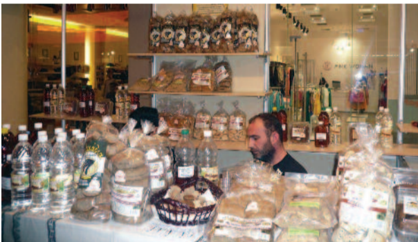
Φωτο επάνω και κάτω: Περίπτερα Σφακιανών παραγωγών στο Ζάππειο.

τών εμπόρων, με τα προϊόντα τους: Μέλι, λάδι, κρασί, τσικουδιά, παξιμάδια κτηνοτροφικά, τυροκομικά, βότανα.