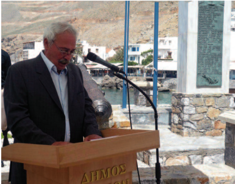
Κεντρικός ομιλητής στον φετινό εορτασμό της Μάχης της Κρήτης στα Σφακιά, ήταν ο Σήφης Μανουσογιαννάκης - Ναύαρχος ε.α υπαρχηγός Γ.Ε.Ν.

Τιμές απέδωσε η μουσική μπάντα της 5ης μεραρχίας στρατού.