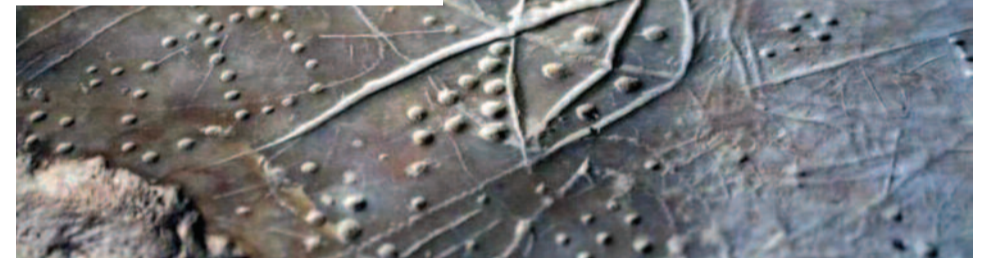
Επάνω: Η είσοδος της σπηλιάς στα Σκορδαλάκκια στο χωριό Ασφένδου Σφακίων. Κάτω: Τα εγχάρακτα σχέδια και οι βραχογραφίες της σπηλιάς, από τη νεολιθική εποχή της Κρήτης (6500 - 5500 π.Χ.)