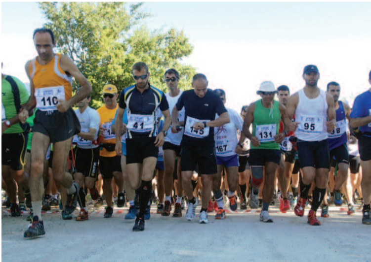
Στη γραμμή εκκίνησης βρέθηκαν τα 163 εθελοντές απ' όλη την Ελλάδα και το εξωτερικό.

Οι ακούραστοι εθελοντές-μέλη του Συλλόγου παρακολουθούσαν την ομαλή διεξαγωγή του, από τα προκαθορισμένα σημεία ελέγχου και τροφοδοτούσαν τους αθλητές με τα απαραίτητα ιστορικά ροφήματα και οι εθελοντές Σαμαριίτες του Περιφερειακού Τμήματος Χα-