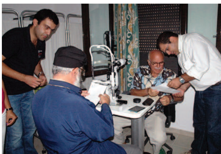
Από την επίσκεψη το 2011 στα Σφακιά, κλιμακίου γιατρών του “Πανεπιστημίου των Ορέων”

Στη διάρκεια της λειτουργίας του, με την ευγενική συμμετοχή 5.000 εγγεγραμμένων εθελοντών - μελών , όλων των ηλικιών, επαγγελματιών και βαθμιδών εκπαίδευσης, έχει πραγματοποιήσει 54 ιατρικές, εκπαιδευτικές και κοινωνικές εξορμήσεις, καθώς και παρεμβάσεις συμβιωματικής παιδείας σε σύνολο 91 δράσεων σε 27 δήμους και πάνω από 80 χωριά ορεινών και απομακρυσμένων περιοχών της Κρήτης και του νοτίου Αιγαίου διανύοντας περισσότερα από 15.000 χιλιόμετρα.