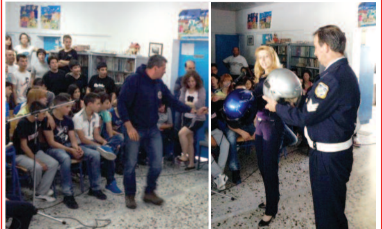
Ημερίδα με θέμα τα « Τροχαία Ατυχήματα και εξαρτησιογόνες ουσίες », διοργανώθηκε στα Σφακιά για μαθητές και γονείς. Ίσως είναι η πρώτη φορά που η Ελληνική Αστυνομία κάνει την παρουσία της στο Δήμο Σφακίων για εκπαιδευτικό χαρακτήρα...

Μια εξαιρετική πρωτοβουλία είχαμε στα Σφακιά με την πραγματοποίηση Ημερίδας, με θέμα τα « Τροχαία Ατυχήματα και εξαρτησιογόνες ουσίες », με σκοπό την ενημέρωση και την ευαισθητοποίηση των μαθητών και των γονέων τους.