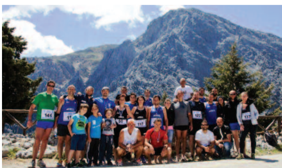
Χανιώτες αθλητές που συμμετείχαν στον αγώνα, μετά τον τερματισμό τους.

Η μικρή γιορτή με τις απονομές στους νικητές του αγώνα, έγινε στις 13:00 μετά το μεσημέρι της Κυριακής και συγκέντρωσε εκτός από τους συμμετέχοντες και αρκετούς φίλους του βουνού και της φύσης.