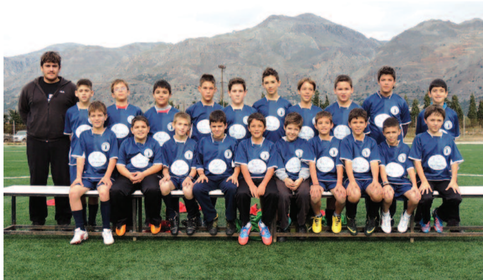
Τα νέα "φιντάνια" του Α. Γ. Σ. Σφακίων: Η ποδοσφαιρική ομάδα Τζούνιορ