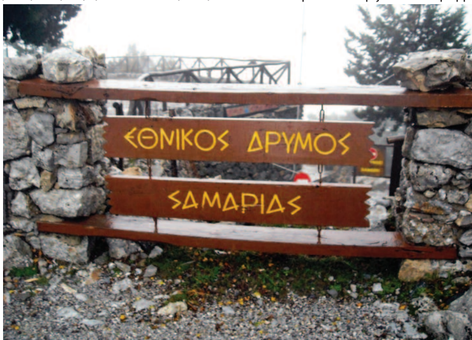
Ο Εθνικός Δρυμός Σαμαριάς, μπορεί να χρηματοδοτήσει ένα έργο που θα συμβάλλει στην παραγωγική ανασυγκρότηση των Σφακίων και στην ήπια και αειφόρο ανάπτυξη