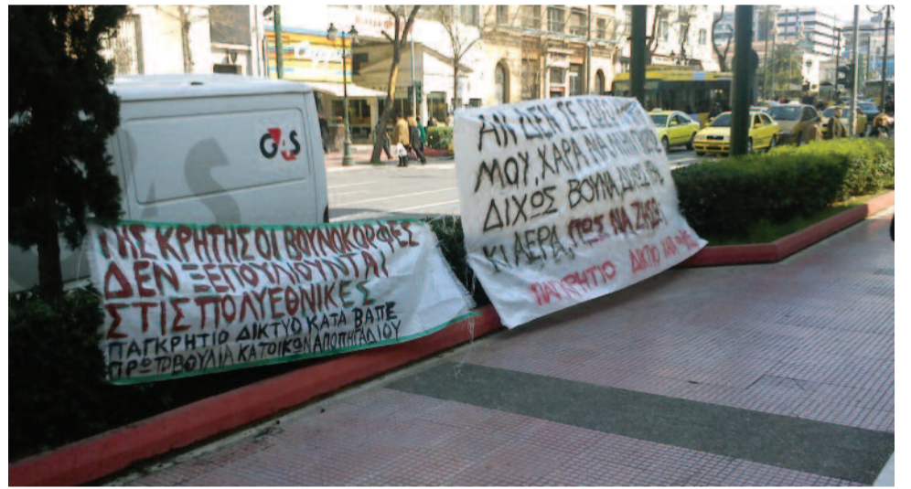
Έξω από την είσοδο του κτιρίου του Σ.τ.Ε., στην οδό Πανεπιστημίου, τοποθετήθηκαν πανό με συνθήματα όπως της παραπάνω φωτογραφίας.

Τα τρία σχέδια υπάγονται στο πρόγραμμα προσέλκυσης των στρατηγικών επενδύσεων INVEST IN GREECE, το οποίο βρίσκεται σε εξέλιξη από το 2010 και εντάχθηκαν τον Ιούνιο του 2012, από την υπηρεσιακή κυβέρνηση εν μέσω εκλογών, στον αντισυνταγματικό νόμο για τις Στρατηγικές Επενδύσεις (Ν. 3894/2010), γνωστό ως Fast Track..