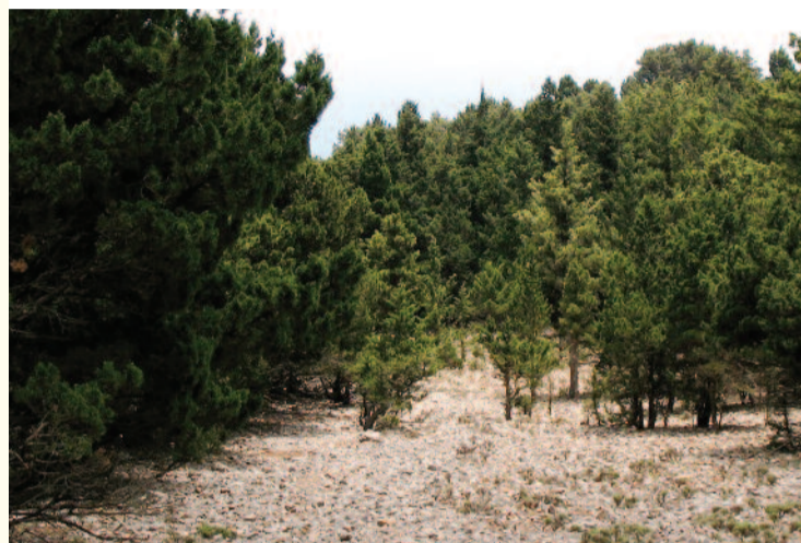
Ελάχιστα από τα πυκνά δάση πεύκων και κηπαρισίων που υπήρχαν στις Βορειοδυτικές περιοχές των Σφακίων, έχουν μείνει.

Βέβαια, το εισηγμένο από τη Δύση φεουδαλικό σύστημα αδυνατούσε να ενσωματώσει τόσο τις μη καλλιεργήσιμες ιδιοκτησίες, όσο και ολόκληρο το πλέγμα