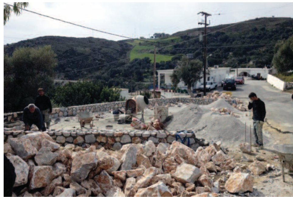
Εικόνες από τα έργα διαμόρφωσης Πλατείας στον Αργουλέ. Ο οικισμός άλλαξε όψη

Όπως επίσης τονίζει ο Π. Πολάκης «έχουμε προτείνει την ανάπλαση του κτηρίου του Μπικουβάρη στ' Ασκύφου,