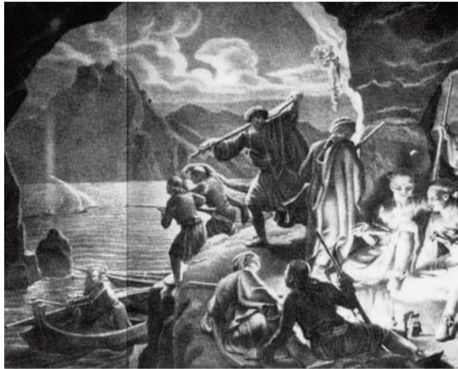
Εικόνα 1 - Μανιάτες Πειρατές

Με τη μουσική από τα κουδούνια των κοπαδιών να συμπληρώνει το κελάιδιασμα των πουλιών και το τραγούδι της λύρας πάνω στη Σφακιανή Μαδάρα του τότε. Όπως και σήμερα.