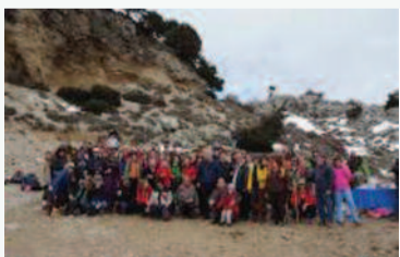
Η κοπή της πίτας του Ορειβατικού Συλλόγου Χανίων, έγινε φέτος στους Λάκκους Σφακίων

Την Κυριακή 13 Γενάρη 2013, έγινε η κοπή της πίτας του Ορειβατικού Συλλόγου Χανίων , στους Λάκκους , πάνω από την Ιμπρο Σφακίων . Μικροί και μεγάλοι, αρχάριοι και έμπειροι, νεαροί μα και βετεράνοι, περπάτησαν μιάμιση ώρα από το χωριό, στην τοποθεσία με θέα το Λιβυκό πέλαγος , όπου σε εορταστική ατμόσφαιρα έγινε η κοπή της πίτας και οι συμμετέχοντες γεύτηκαν τις χειροποίητες βασιλόπιτες, αλλά και άλλα γλυκά, που ήταν προσφορές από μέλη του Συλλόγου.