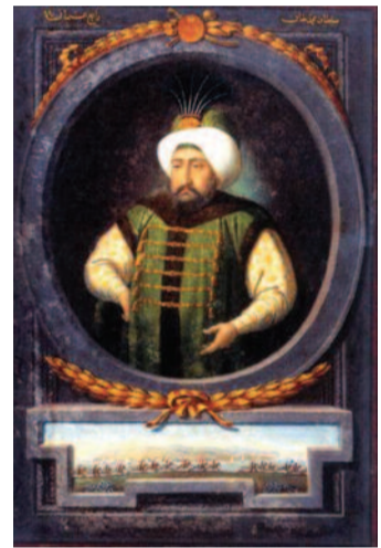
Εικόνα 3- Mehmed IV "Avci" (Ο Κυνηγός) (Πηγή - Internet)

Το μέχρι τώρα, βιλαέτι ή εγιαλέτι της Κρήτης ( Girit eyalet ) του 1659, αποτελεί, μια ασαθρή μεν, αλλά αυτοτελή διοικητική ενότητα μέσα στην Οθωμανική Αυτοκρατορία και έχει δύο νομούς-Sajak-Σαντζάκια. Το έγγραφο που μελετάμε αποτελεί μια ιεροδικαστική πράξη και είναι ένα τυπικό δικαστικό έγγραφο