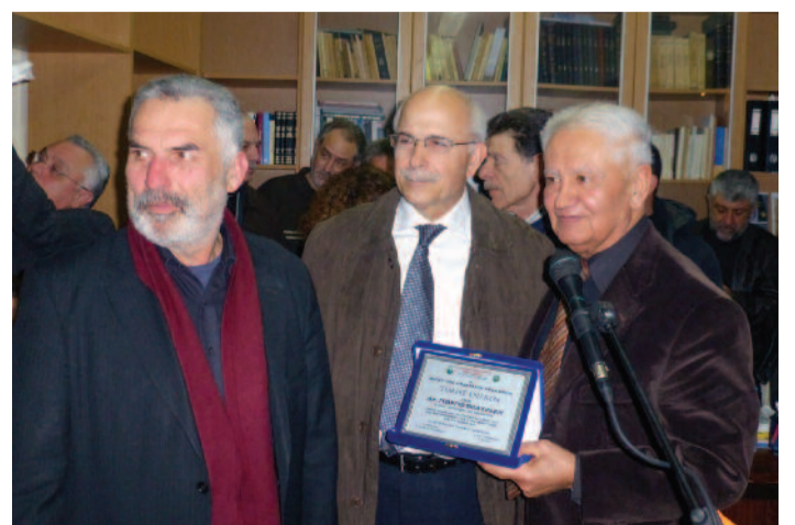
Απονόμη τιμητικής πλακέτας από τον Πρόεδρο Σήφη Μανουσσιγιάννη, στον εκλεκτό επιστήμονα γιατρό και συγγραφέα για την συνολική προσφορά του στον πολιτισμό και τα γράμματα.