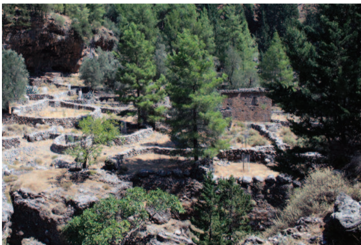
Το χωριό Σαμαρειά. Οι κάτοικοι του το εγκατέλειψαν το 1962, όταν το ομώνυμο φαράγγι έγινε Εθνικός Δρυμός.

Τον καιρό που η Κρήτη ήταν κοσμοκράτειρα και θαλασσοκράτειρα, η Διοίκησή της και οι Λαοί της έφθαναν έως τα πέρατα της Ασίας. Μα εκεί όπου στέριωσαν για τα καλά, ήταν η Πρόσω και Μέση Ανατολή, συμπεριλαμβανομένης και της Βόρειας Αφρικής (Αίγυπτο, Λιβύη κ.τ.λ. Ηράκλειες Στήλες). Εξάπλωσε τον πολιτισμό της, αλλά και τη θρησκεία της. Ίδρυσε πόλεις, ιερά, μαντεία, ναούς κ.τ.λ. Ο θεός Ουρανός (Κρόνος - Δίας), που ήταν η ίδια θεότητα με ανάλογα ονόματα κατά τόπους, λατρεύτηκε και εκτός Κρήτης π.χ. Αμμων Δίας στην Όαση Σίβα, όπου και Μαντείο του Αμμων Ρα.