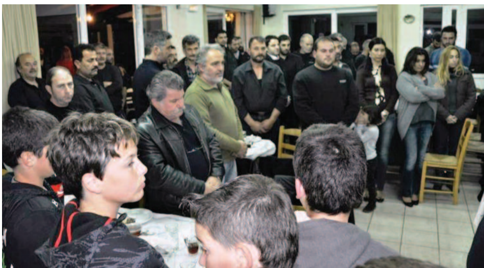
Η Κοπή της Πίτας του Α. Γ. Συλλόγου Σφακίων, έγινε σε μια όμορφη και ζεστή βραδιά, όπου συγκεντρώθηκαν όλοι οι αθλητές και τα παιδιά της Ακαδημίας, μαζί με τους γονείς τους και τους φίλους του Συλλόγου, για ν' ανταλλάξουν ευχές για την καινούρια χρονιά.

Κατά τη διάρκεια αυτής της εκδήλωσης, οι χορηγοί του Α.Γ.Σ.Σφακίων, μοίρασαν αθλητικό υλικό, στους αθλητές και στα παιδιά της