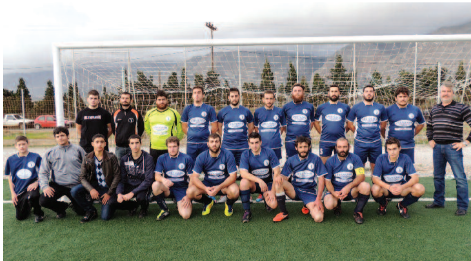
Η ποδοσφαιρική ομάδα του Α. Γ. Σ. Σφακίων, στο γήπεδο του Φραγκοκάστελλου. Η πορεία της στο τοπικό πρωτάθλημα είναι και φέτος εξαιρετική.

Ελπίζουμε να καταφέρουμε σε λίγο καιρό να μπορέσουμε να κατασκευάσουμε μια εξέδρα η οποία είναι απαραίτητη και κάνει την παρακολούθηση των αγώνων πιο ευχάριστη. Τα καθίσματα τα έχουμε ήδη παραλάβει και βρισκόμαστε στο στάδιο της αγοράς των απαραίτητων υλικών (σίδερα) για την κατασκευή τους την οποία έχουν εκφράσει την διάθεση να κατασκευάσουν εθελοντικά συντοπίτες μας. (Όποιος μπορεί και θέλει να βοηθήσει μπορεί να επικοινωνήσει μαζί μας).