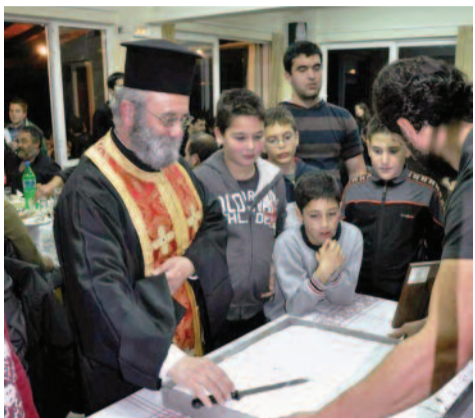
Με τις ευχές και την ευλογία του αιδεσιμότατου, που ετοιμάζεται να κόψει τη βασιλόπιτα...

Τέλος θέλουμε να ευχαριστήσουμε τους μικρούς και μεγάλους αθλητές του συλλόγου και ιδιαίτερως τις οικογένειές τους, για την στήριξη που μας προσφέρουν συμμετέχοντας σε όλες τις εκδηλώσεις του Α.Γ.Σ.Σφακίων.