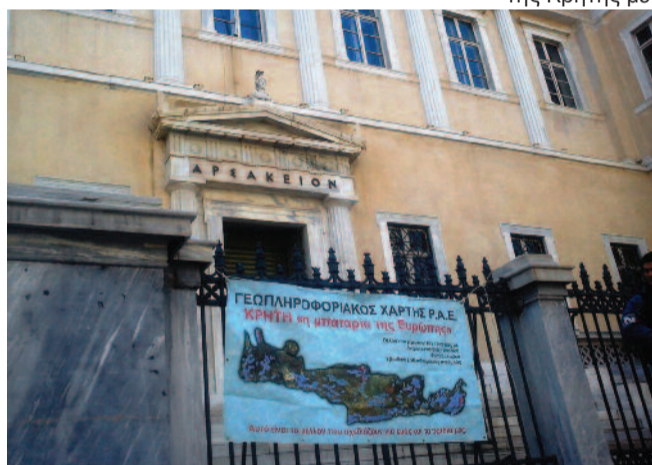
Παρότι το Σ.Τ.Ε. δέχεται ακρόαση μόνο από το δικηγορικό προσωπικό, στην παρακολούθηση της δίκης παρευρέθησαν αρκετά μέλη του Παγκρητίου Δικτύου κατά των Β-ΑΠΕ και κάτοικοι της Κρήτης.

Θεριά οι ανθρόποι δεν μπορούν το φως να το σηκώσουν δεν είναι η αλήθεια πιο χρυσή απ' την αλήθεια της σιωπής χιλίες φορές να γεννηθείς τόσες, τόσες θα σε σταυρώσουν. Κώστα Βάρναλη "Οι πόνοι της Παναγιάς"