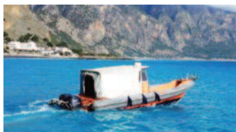
Δεκάδες επεμβάσεις και διασώσεις έχει κάνει το Νοσοκομειακό σκάφος «ΔΟΞΑ» στα Σφακιά.

Μια δημόσια μας στην Αγία Ρουμέλη, υπέστη μια άσχημη πτώση και χρειάστηκε ιατρική βοήθεια και μεταφορά στο νοσοκομείο.