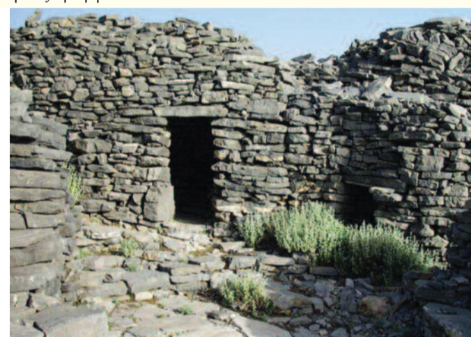
Το μιτάτο ήταν η παραγωγική βάση της Σφακιανής οικογένειας

Το μιτάτο ήταν η παραγωγική βάση της οικογένειας, αλλά συνάμα ως τέτοια επηρέαζε όχι μόνο τις οικονομικές σχέσεις αλλά και την κοινωνική ιεράρχηση στο εσωτερικό της σφακιανής κοινότητας. Αυτή η διάσταση θα μας απασχολήσει σε επόμενο άρθρο μαζί με όλα τα συμπαρομαρτούντα της - τη βεντέτα , τη ζωοκλοπή , την ακροβασία στα όρια της παρβατικότητας . Προς το παρόν, θα εξετάσουμε την κτηνοτροφική δραστηριότητα από καθαρά υλική άποψη.