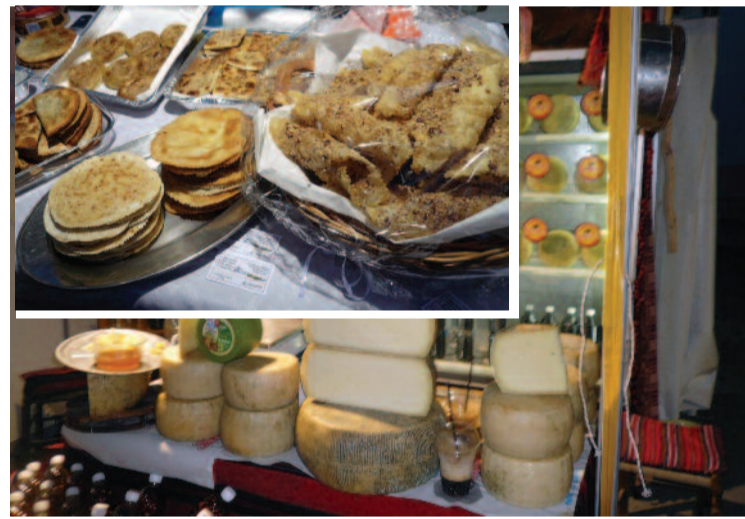
Ιδιαίτερα επιτυχημένη ήταν η συμμετοχή σε εκθέσεις σ' όλη την Ελλάδα, των Σφακιανών παραγωγών αγροτοκτηνοτροφικών προϊόντων.

Στην μεγάλη αυτή έκθεση, θα συναντηθούν επιχειρήσεις που δραστηριοποιούνται και στους τρεις τομείς της παραγωγικής διαδικασίας: μονάδες παραγωγής και μεταποίησης αγροτικών και κτηνοτροφικών προϊόντων, συνεταιριστικές οργανώσεις, εταιρείες από τον ευρύτερο χώρο του τουρισμού, καθώς και εταιρείες που δραστηριοποιούνται στον τομέα της βιομηχανικής παραγωγής και επιθυμούν να αυξήσουν τις πωλήσεις τους, τόσο στην Ελ-