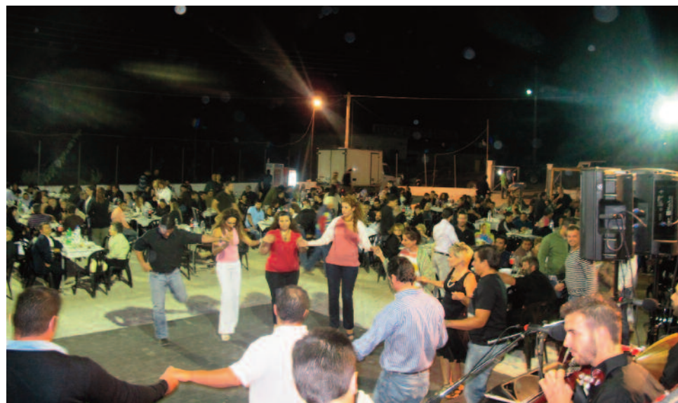
Στην πίστα του χορού, το ένα χωριό διαδεχόταν το άλλο, η μια παρέα την άλλη και μετά χορός απ' όλους μαζί.