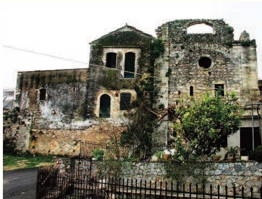
Ο πύργος του Αληδάκη βρίσκεται στο χωριό Εμπρόσνερος του Αποκορώνου. Ο Αληδάκης ήταν ένας πολύ αιμοβόρος γενίτσαρος που μέσα στο κάστρο του καταλύθηκε από τους ανυπότακτους Σφακιανούς. Οι πολεμιστές του πύργου παραμένουν ανέπαφες καθώς και αυτό το τμήμα που γίνονταν η ανταλλαγή των πυροβολισμών

Μετά την τελετή παρατέθηκε γεύμα από το δήμο Σφακίων και τους τοπικούς παράγοντες του Ασκύφου.