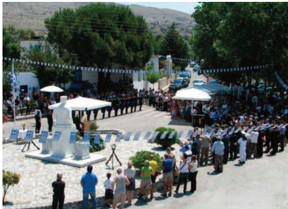
“ Το αίμα που σε πότισε ο ξένος μακελλάρης, για δεξ τι Απρίλης γύρω σου, ροδίζει και γελάει! ” Κ. Π.

εκείνον τον μνημειώδη αγώνα, πως οι Κρήτες δεν εξισλαμίζονται, δεν υποδουλώνονται, μάχονται μόνο για λευτεριά και δικαιοσύνη στο πλευρό όλων των Ελλήνων. Διόλου τυχαία εξάλλου, σαράντα χρόνια μετά το ολοκαύτωμα της επανάστασης του Δασκαλογιάννη του 1770, ομόφωνα όλοι οι Κρήτες οπλαρχηγοί, δίνουν την αρχηγία της κρητικής επανάστασης του 1821, στους Σφακιανούς οπλαρχηγούς . Τέτοιες ηγετικές φυσιογνωμίες - θεριά Ελλήνων - γέννησαν τα Σφακιά, τις οποίες σήμερα μνημονεύουμε με υπερηφάνεια, δίχως παράλληλα να καταφέρουμε να συγκρατούμε τη βαθιά μας θλίψη, βγαλμένη από τα βάθη της καρδιάς μας για το σημερινό έλλειμμα τέτοιων ηγετικών μορφών, όταν παρατηρούμε ότι με εξαίρεση ελάχιστα διαχρονικά, οι σημερινοί μας ηγέτες δεν διδάσκονται από τα πλήρους ελληνικής σοφίας και αμετάκλητου πατριωτι-