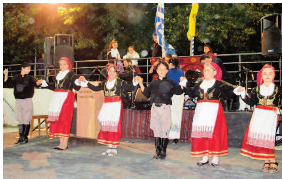
Τα μικρά Ασκυφιωτάκια, σέρνουν πρώτα το χορό...

Μετά τη θεία λειτουργία, η ενορία Ασκύφου δεξιώθηκε τους παρευρισκόμενους