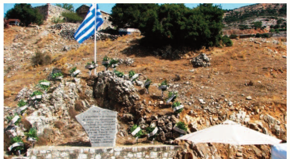
Η αναμνηστική πλάκα στ' Ασκύφου για την καταστροφή που Αληδάκη

εξολοθρεύοντας τον αιμοσταγή γενίτσαρο Ιμπραήμ Αληδάκη, με τον ιδιωτικό του στρατό. Αυτό το μικρό κομμάτι της μεγάλης αγωνιστικής, ηρωικής πορείας των Σφακίων, μού γίνεται η τιμή, όχι να αναλύσω ως ιστορικό φαινόμενο και γεγονός, αλλά να ψάξω με τα ακροδάχτυλα της ψυχής και του συνειδησιακού είναι μου, τα μηνύματά του. Τρόμος,