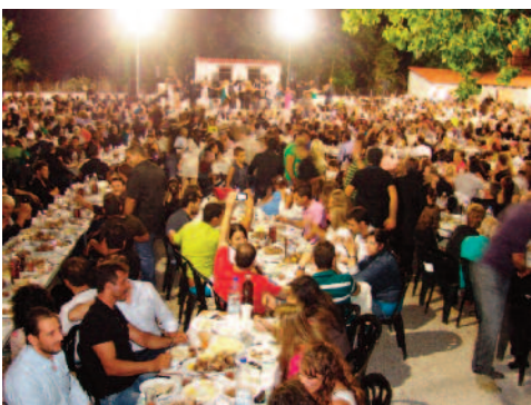
Απίστευτη κοσμοσυρροή φέτος στη γιορτή της γραβιέρας, στην Ανώπολη