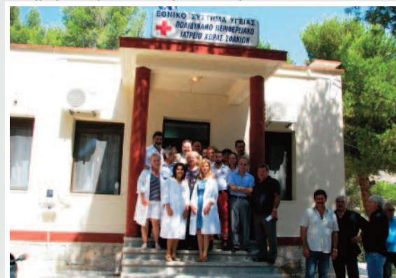
Γιατροί και νοσηλευτικό προσωπικό, για μία αναμνηστική φωτο, στην είσοδο του Ιατρείου.

Τέλος αναφορά πρέπει να γίνει και σε φίλους ιατρούς οι οποίοι βρέθηκαν στην περιοχή για διακοπές και βλέποντας την προσπάθεια που γίνεται, εξέτασαν αρκετούς ασθενείς και πρόσφεραν εθελοντικά τις γνώσεις και τις υπηρεσίες τους.